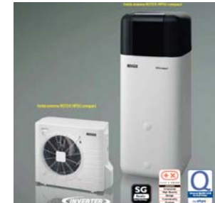
POMPA DI CALORE