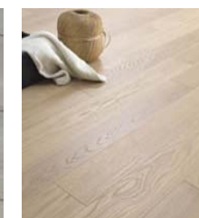
PAVIMENTO IN LEGNO