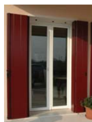
SERRAMENTI E SCURI