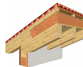
TETTO A VISTA "NATURE"