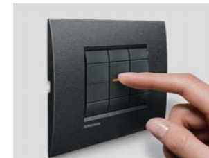
IMPIANTO ELETTRICO COMPLETO