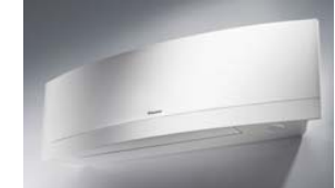
SISTEMA DI RAFFRESCAMENTO