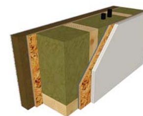
PARETE PLATFORM "BASIC EASY"