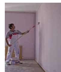
PITTURE E CARTONGESSI