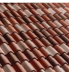
MANTO DI COPERTURA