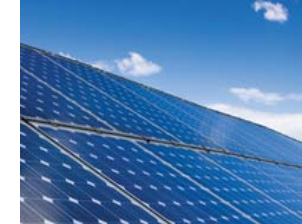
IMPIANTO FOTOVOLTAICO 3 kwp