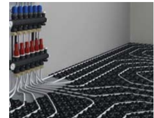
SISTEMA RADIANTE A PAVIMENTO