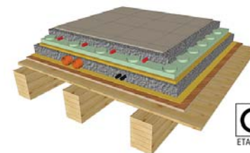
SOLAIO INTERPIANO "NATURE"