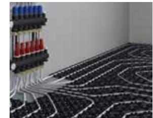
SISTEMA RADIANTE A PAVIMENTO