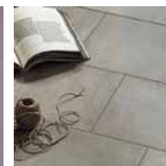
PAVIMENTO IN GRESS