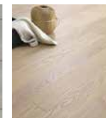
PAVIMENTO IN LEGNO