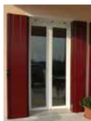
SERRAMENTI E SCURI