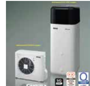
POMPA DI CALORE