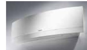
SISTEMA DI RAFFRESCAMENTO