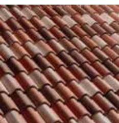
MANTO DI COPERTURA