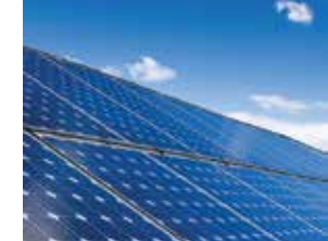
IMPIANTO FOTOVOLTAICO 3 kwp