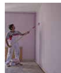
PITTURE E CARTONGESSI