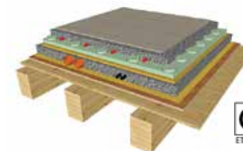
SOLAIO INTERPIANO "NATURE"