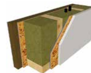
PARETE PLATFORM "BASIC EASY"