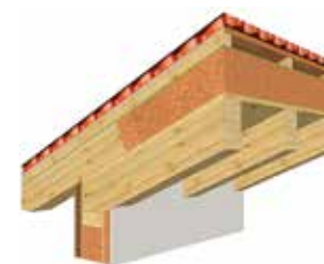
TETTO A VISTA "NATURE"