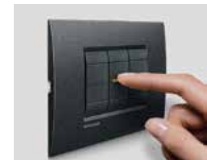
IMPIANTO ELETTRICO COMPLETO